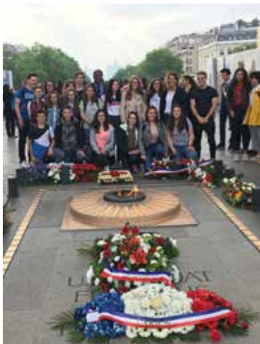
Dépôt d'une gerbe sous l'arc de triomphe, dans le cadre du concours de la résistance et de la déportation

La thématique de l'engagement est un des 3 axes du projet et du contrat d'objectifs de l'établissement, toute la communauté pédagogique et éducative du collège Jacques Gruber a mis en place de très nombreuses actions centrées sur la notion d'engagement pour permettre à chaque élève de développer des compétences civiques et citoyennes.