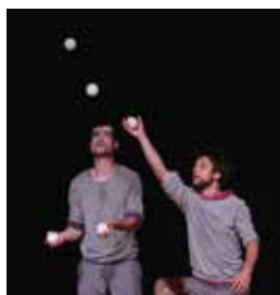
Ça Joue ? par le collectif « Merci Laratrape » à 19h30

Réservation au 06 52 26 08 71 – uniquement pour les spectacles