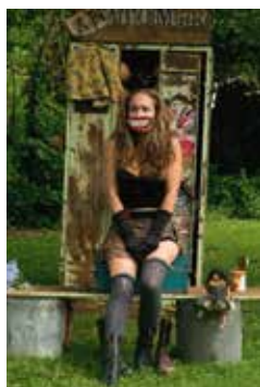
« ANATOMIK » de Madam 'Kanibal à 20h45