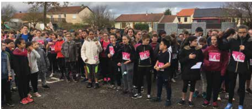
Cross ELA avec l'école de Colombey-les-Belles

L'idée est que chacun puisse s'engager individuellement et/ou collectivement dans des actions interdisciplinaires, dans leurs différents parcours pédagogiques (éducatif de santé, citoyen, avenir, éducation artistique et culturelle) qui visent à développer la citoyenneté à travers la fraternité, le vivre ensemble, le développement durable, pour acquérir de nouvelles connaissances et une attitude responsable face aux enjeux de société. Les activités concernent par exemple : les cadets de la défense, la réduction et le recyclage des déchets, la lutte contre le gaspillage alimentaire, les sorties pédagogiques pour découvrir les produits bio et locaux des agriculteurs locaux, la médiation par les pairs, les actions de solidarité (course pour ELA, dons pour le téléthon), les concerts de la chorale, le travail de mémoire avec les élèves de 3 e , les ateliers artistiques ... L'établissement participe également aux projets Fraternité(s) et Santé (alimentation et sport) et développement durable du bassin d'éducation et de formation de Toul. Pour cet évènement les élèves préparent des vidéos sur ces thématiques qui seront projetés devant les autres élèves à l'Arsenal de Toul, les 27-28 mai. Plus d'informations sur https://clg-gruber.monbureaunumerique.fr/