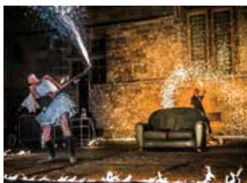
« Amor » par la Cie Bilbobasso à 22h00